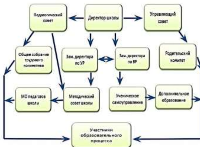
Структура и органы управления образовательной организацией

Краткие сведения о структуре образовательной организации.